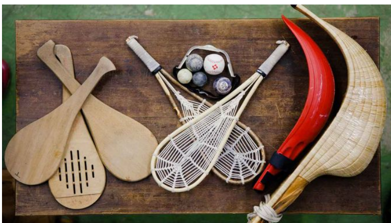
La pelote basque pour Thomas